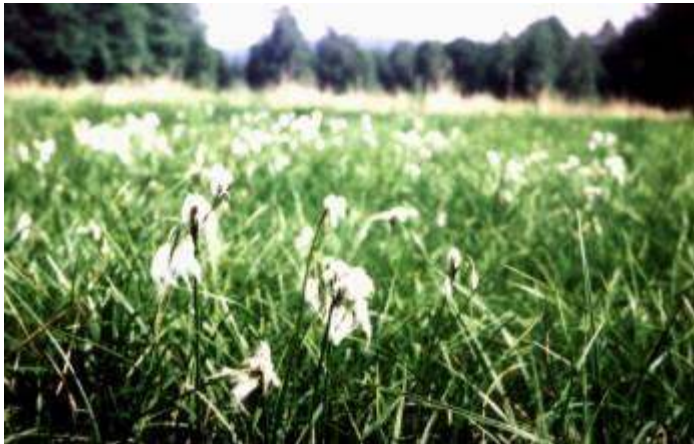
suchopýr úzkolistý ( Eriophorum angustifolium ) a rašeliník jako typické rostliny rašelinišť