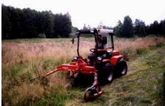
péče o přírodní památku "Hübelschenmoor"